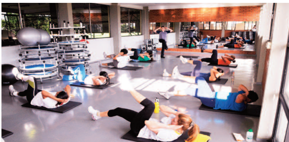
Aulas de ginástica também ajudam na perda de peso e redução de medidas

A pontuação da maratona será contabilizada entre os dias 13 e 16 de dezembro. Para a classificação serão avaliados os seguintes quesitos que também servirão para critério de desem-